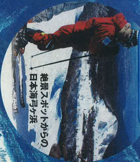
絶景スポットからの 日本海弓ヶ浜