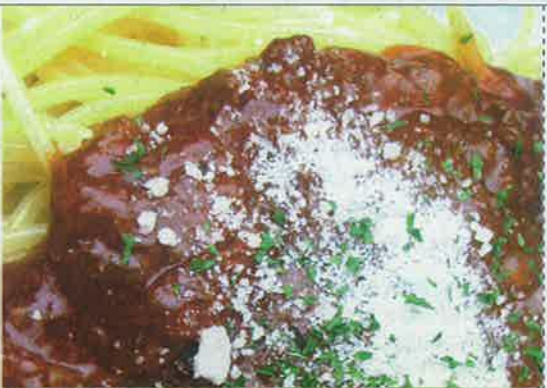
3・スパゲッティナー 650円(週末限定) 麺にマッシュしたミートソースが絶品のスパゲッティナーです。

●レストラン230名 レストランの窓際からはゲレンデを眺めることができ、230席でゆったりと座ることができます。