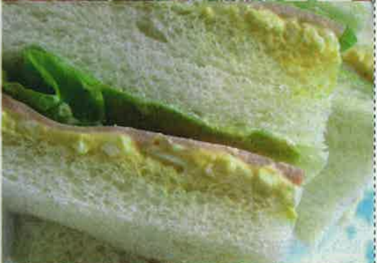
2・ミックスサンド 550円(週末限定) 自家製の作りたてミックスサンドです。