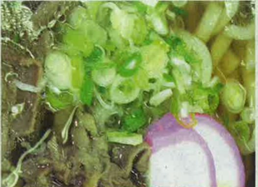
2・肉うどん 650円 ジューシーな肉うどんがベストマッチの上の原名物です。