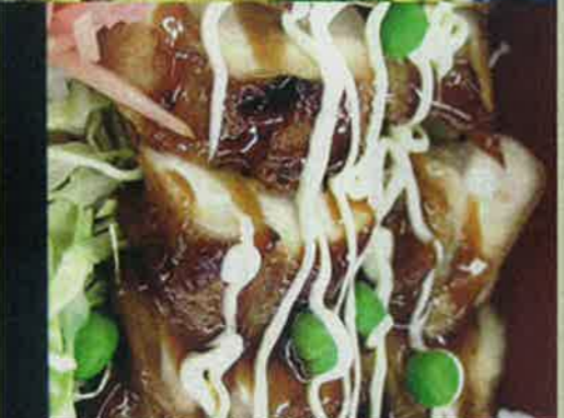
2・テリやき子キン井 750円 人気No.2.番は、ゆおりの温かなご飯が、食欲をそそります。