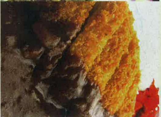
1・カツリハヤシ 950円 カツリハヤシのハヤシソースの相性も良く、新発見の味!