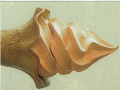
3・紅茶ソフト 300円 地元産糖の紅茶を使用。

●レストラン330名 ライトな窓を通して、ゲレンデ、さらにその向こうにそびえ立つ雄大な大山を眺めながらお食事か楽しめます。