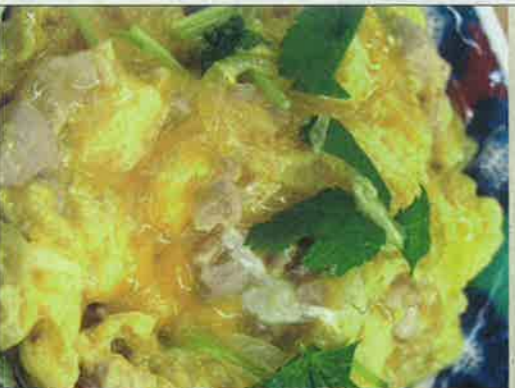
3・親子丼 750円 地元大山のがいな鶏を使用しています。