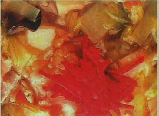
2・中華丼 900円 奥沢山で築業パランスはっちり