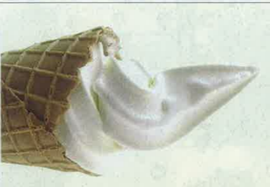
3・生乳ソフトクリーム 300円 上質な味とまるやかな風味の濃厚ソフト。

●レストラン280名 レストランはナイター時も営業しています。2階には30畳の「くつろぎの部屋」でブーツを脱いで休憩頂けます。また更衣室・コインロッカー・スキーロッカーも完備しています。