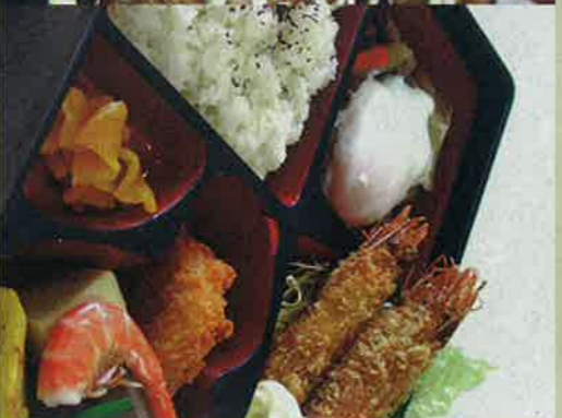
1・週替わりランチ 1000円 毎日限定30食。