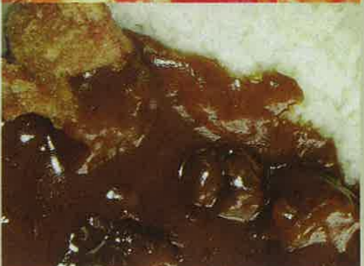
1・唐揚げカレー 900円 アツアツの唐揚げでボリュームたっぷり