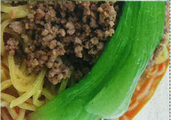
1・担々麺 780円 ピリ辛で体があつたまるにこでしか食べられない!